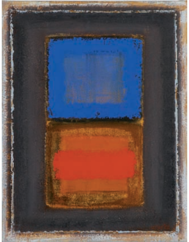
Sunrise , 2008