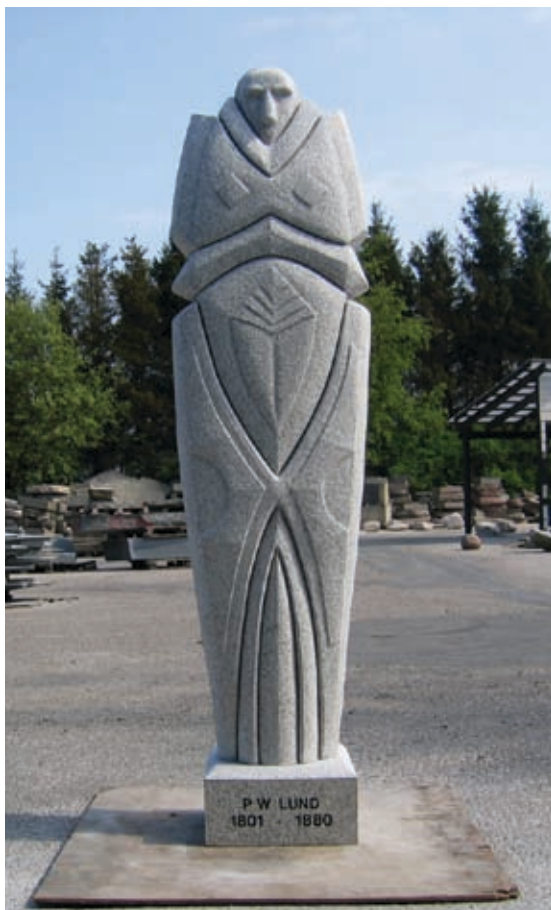
Janus-figur med to ansigter Skulptur til Peter Wilhem Lunds grav i Lagoa Santa, Brasilien.

Billedhugger. Repræsenteret med både mindre og monumentale værker i offentlige og private samlinger i 35 lande i og udenfor Europa