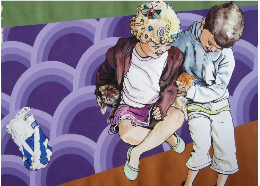
Børn og killinger

Glænøvej 380, Glænø, 4230 Skælskør, tlf. 5816 7167, e-mail: aro@c.dk www.annirose.dk