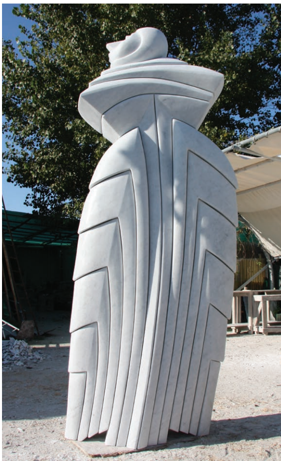
Dansens Muse Skulptur til Teatro Bolshoi, Joinville, Santa Catarina, Brasilien